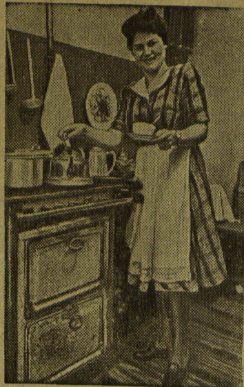
МОСКВА. За последние месяцы еще несколько тысяч москвичей квартир получили саратовский газ. На снимке: саратовский газ на кухне одной из квартир жилого дома.